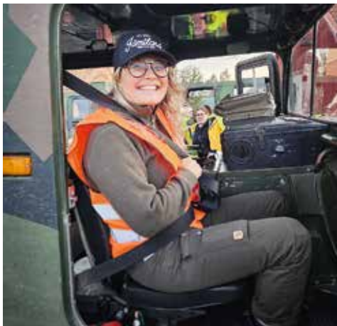
► Tjejträff i Östersund.

INSATSER SOM KRONOBERG genomfört är bland annat en tjej-AW på en bilfirma där man fick guidning om vad som är bra att tänka på vid bilköp, ekonomi och rusta sin bil för vintern. Man har haft ett