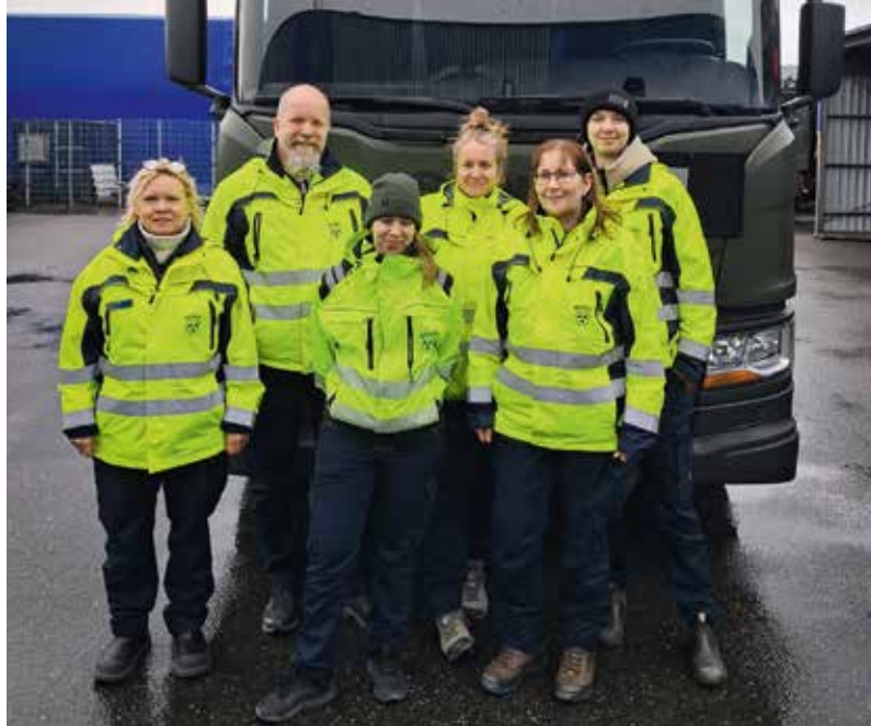
➔ De första förarna som utbildas till uppdrag för Riksantikvarieämbetet.

U tbildningen till civilt C-körkort i höstas var något av en pilotutbildning. Bilkåren hade nämligen inte arrangerat en sådan utbildning sedan slutet av 90-talet.