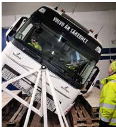
➔ Riskutbildning är en viktig del av utbildningen till lastbilsförare.

I krig efter krig har kulturen varit en stor del av förlusten. Värden som är svåra att återställa har försvunnit, sålts eller förstörts. Att undanföra och säkra de viktigaste