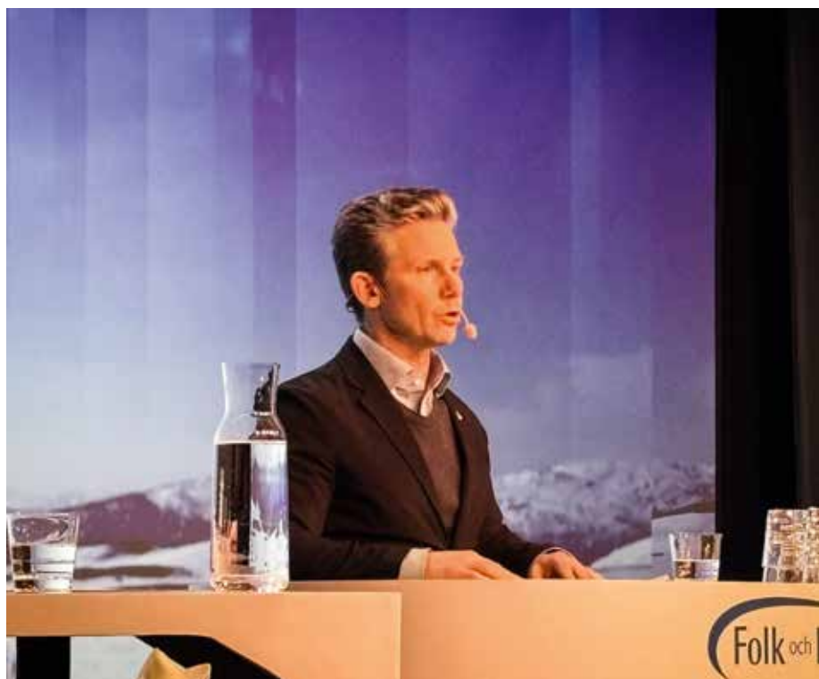
➔ Försvarsminister Pål Jonson talade.

Rikskonferensen är ett unikt tillfälle där beslutsfattare, myndighetsföreträdare, företagsledare och organisationsföreträdare kan