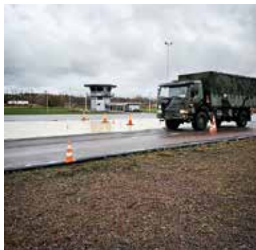
► Halkkörning ingår i utbildningen.

UTBILDNINGEN VAR UTMANANDE på många sätt. Det både skaver och