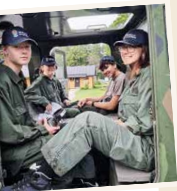
→ Glada deltagare vid Defense Camp, Marma Skjutfält.