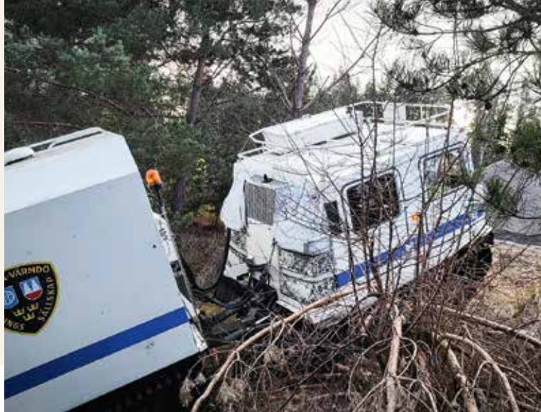
➔ Lättare terrängkörning ingick i utbildningen.