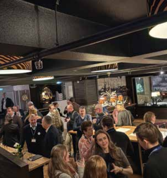
➔ Frivilliga Försvarsorganisationernas mingel.

resurs i totalförsvaret och knyta kontakter,