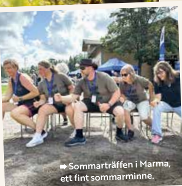
→ Sommarträffen i Marma, ett fint sommarminne.

– Stockholms Bilkårs 85-årsjubileum blev en succé som blev högt uppskattad bland våra medlemmar.