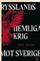
RYSSLANDS HEMLIGA KRIG MOT SVERIGE Patrik Oksanen