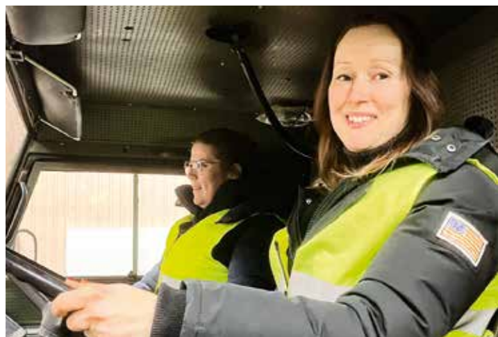
➔ Nöjd deltagare bakom ratten.

– Många av dem som varit med på en sån här kväll har blivit medlemmar i kåren och