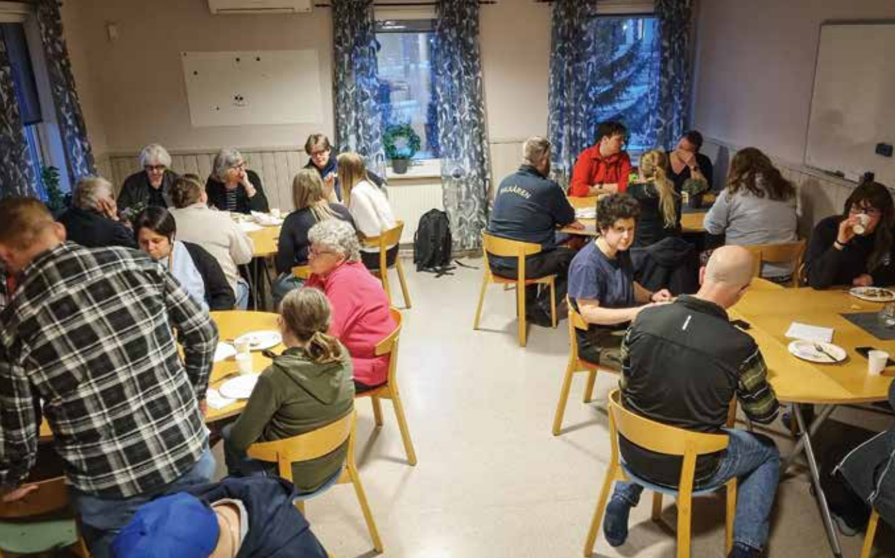
➔ Medelpads Bilkår samlade 30 deltagare till årets Trafikquiz.