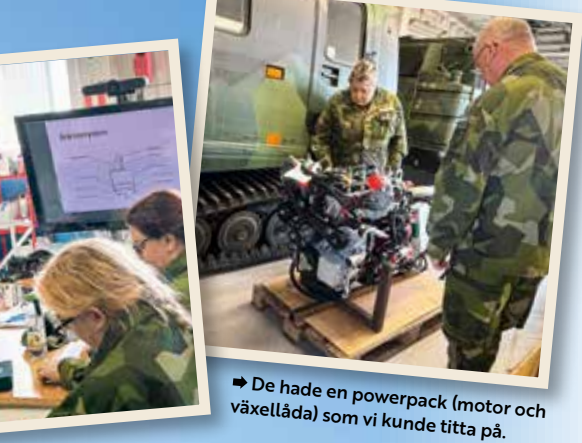
➔ De hade en powerpack (motor och växellåda) som vi kunde titta på.

de system. En liten del av den utbildningen består av körning. Först ut för denna kompletteringsutbildning var Bilkårens bandvagnsinstruktörer, som under en helg i april var på plats i Söderhamn för att lära sig om den modifierade modellen.