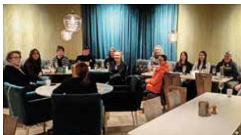
➔ Umeå Bilkår samlade tjejer ur kåren för att bolla idéer om hur kåren ska rekrytera och engagera fler kvinnor.