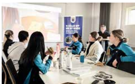
➔ Kronobergs Bilkår genomförde frukostmöte för tjejer på Postnord.

Stockholm, Kronoberg, Helsingborg, Gotland och Syd Östra Skåne. Dessa kårer ingår i ett projekt nätverk där man deltar i projektledarträffar och genomför aktiviteter för att dela med sig och sprida erfarenheter. Finansiering sker genom projektet. Som pilotkår har man åtagit sig att bland annat genomföra en prova på-aktivitet för