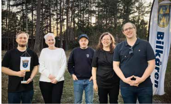
➔ Roslagens Bilkårs styrelse.