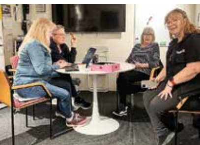
➔ Medlemmar på Gotland kämpade för sin kår med bravur.

En timme. 41 kårer på olika platser. 20 klu-