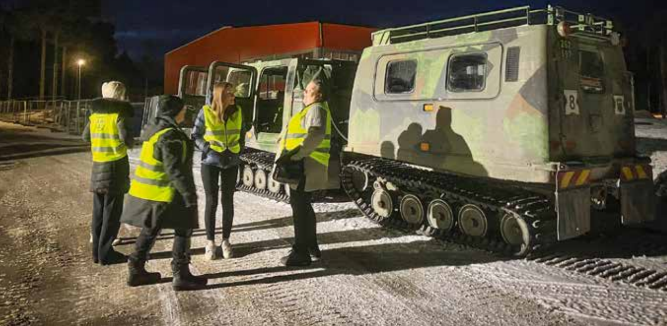
➔ På väg ut på bandvagnstur.

börjat engagera sig, vilket ju självklart är målet.