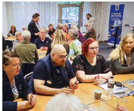
➔ Funktionärer med ansvar för totalförsvarsinformation samlades.

Stor del av helgen ägnades åt kunskapshöjning och diskussioner om krisberedskap och totalförsvar. Vad är aktuellt inom beredskapsområdet, hur är Sveriges struktur uppbyggd, juridik, säkerhetsskydd och de frivilliga försvarsorganisationerna var en del av agendan. De krisberedskapsansvarige genomförde också en mindre diskussionsövning om varje kårs geografiska område, vilka kompetenser Bilkåren kan stötta med vid en kris och hur vi ska hjälpas åt att sprida information från kansliet, via de krisberedskapsansvariga och ut till varje enskild medlem.