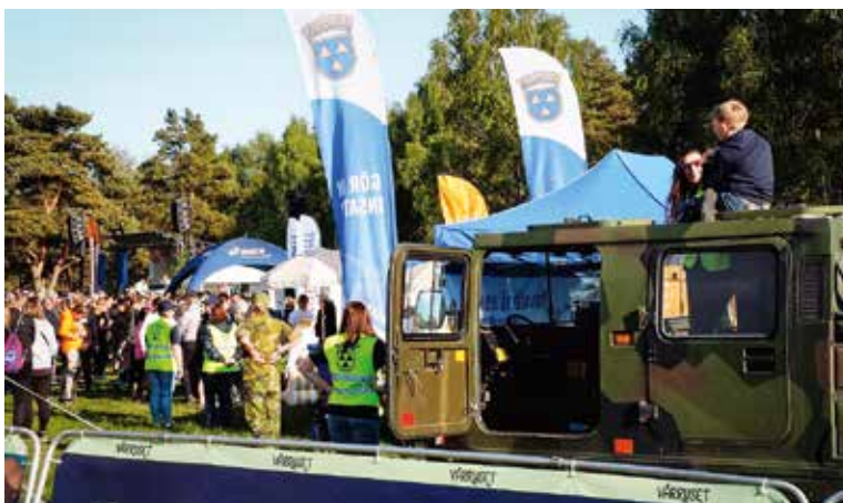
→ Premiär i Halmstad för Våruset turnén.