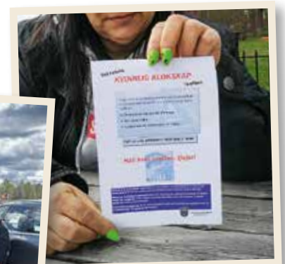
➔ Gävle Bilkår kämpade väl.