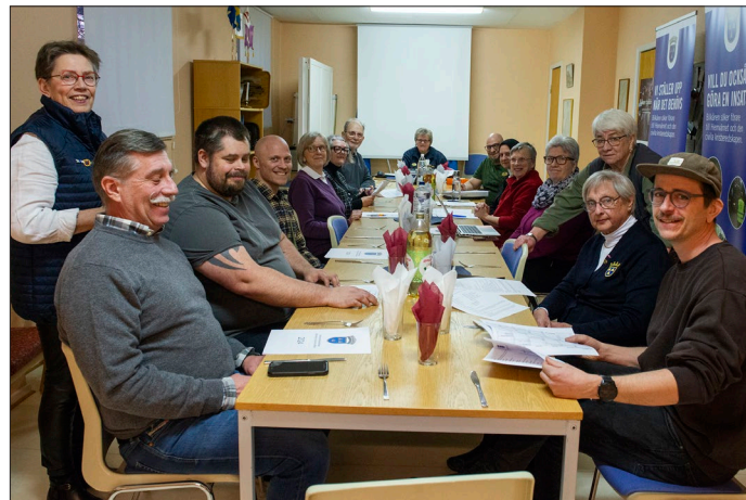
Många glada bilkårister på årsmötet. Fler bilder från årsmötet finns från förra utskicket.