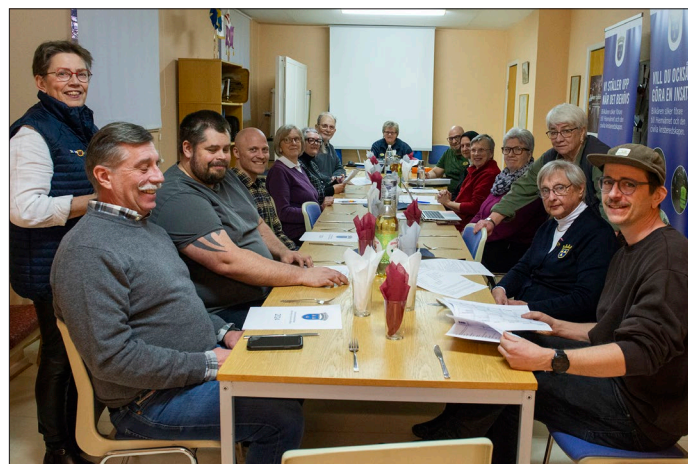
Många glada bilkårister på årsmötet. Fler bilder från årsmötet på nästa sida.