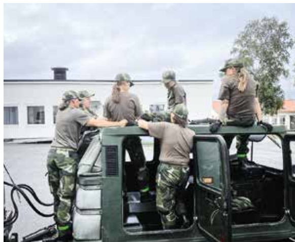
► Pilotkurs för kvinnor i Härnösand.

som man vill vända på. Några har kritiserat detta initiativ och menat att om inte kvinnor kan göra sin utbildning i blandade grupper kommer de inte heller att kunna verka i förbandet sedan.