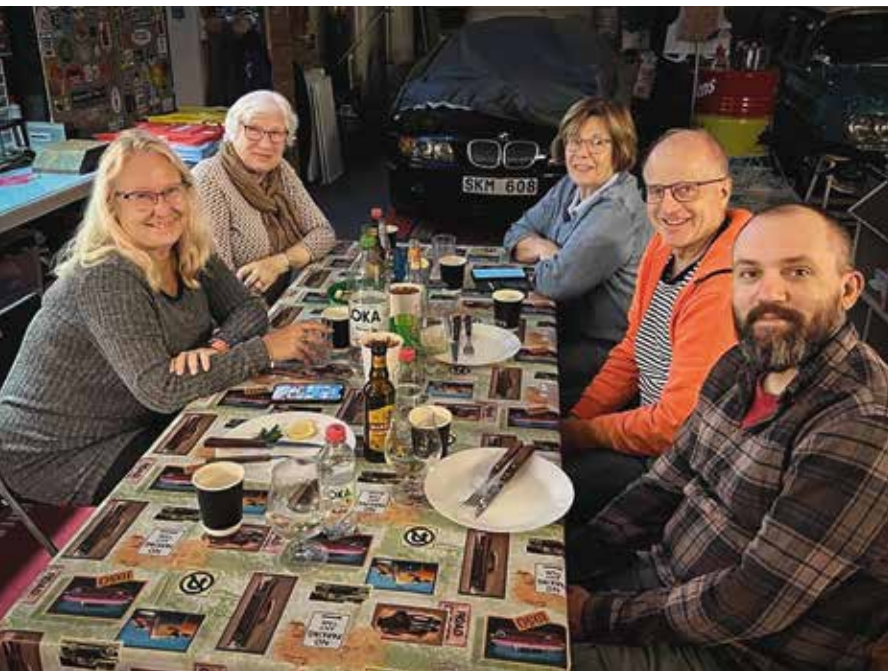
➔ Enköpings Bilkår blev vinnare av årets krisquiz.