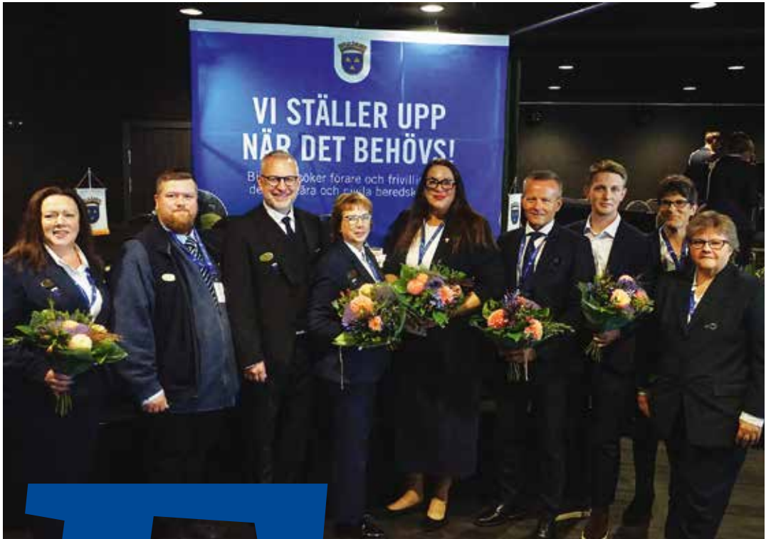
➔ Centralstyrelsen 2022–2024.