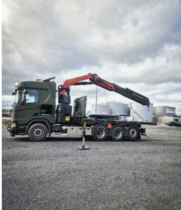
► Teracoms egna fordon med kran och lastväxlare.

BÅDE UTBILDNINGAR OCH övningar för kårens krisberedskapsansvariga kommer att genomföras regelbundet. Rollen är viktig för att Bilkåren ska kunna bidra vid olika typer av samhällsstörningar. Mycket går att planera i förväg och då fyller våra avtal med olika myndigheter en viktig roll. Vissa saker är svåra att förutse och då behöver vi vara redo att lösa uppgifter på annat sätt. ●