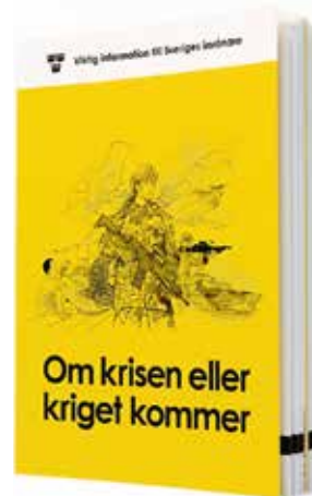
→ Det är viktigt att läsa broschyren när den kommer.

Nyheten om broschyren presenterades av MSBs generaldirektör