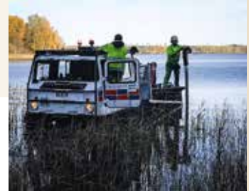
➔ Bandvagnsförare från Trafikverket vid insats i Fagersta vid montering stängslet som förväntas minska smittspridningen av svinpest.

Bilkåren har bidragit med resurser vid flera händelser den senaste tiden.