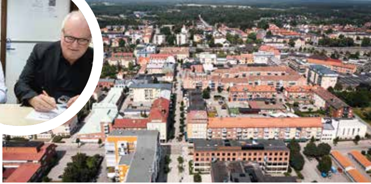
➔ Samarbetsavtal mellan Bilkåren och Katrineholms kommun undertecknas.