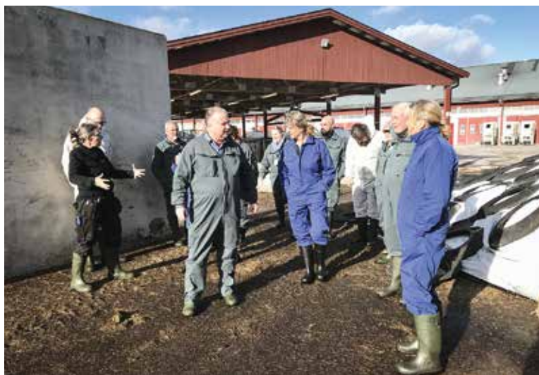
► Testutbildning av den grundläggande foderkursen i pilotprojektet om robust foderförsörjning.