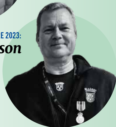
BILKÅRENS KUNGLIGA MEDALJ I SILVER