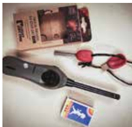
➔ Bra saker att tända eld med.

• Hur ska du tillaga den? Tänk särskilt på brandrisken om du vill laga varm mat. Ställ till exempel aldrig ett stormkök under en spisfläkt.