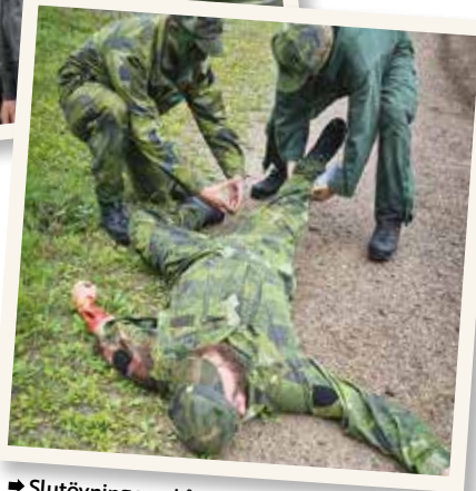
➔ Slutövning med åtgärder vid olycka, här omhändertaras en person med ben och armskador.