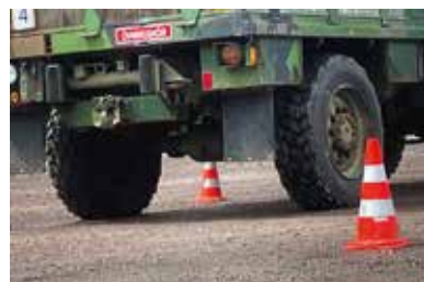
➔ Övningskörning med terrängbil 30.

Efter lunchuppehåll blev det dags att träffa elevgruppen. Isoz berättade lite om de utmaningar som finns, utifrån omvärldsläge och tillväxten av försvaret. I sin roll som logistikchef är han bland annat ansvarig för personlig utrustning i Försvarsmakten och ägnade en