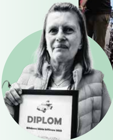
BILKÅRENS BÄSTA BILFÖRARE 2023: