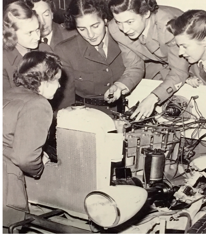
→ Utbildning i motorkunskap 1949.

SKBRs emblem togs fram på 1950-talet och det internationella triangeltecknet för maning och varning uttrycktes i de tre trianglarna som symboliserar vårt motto "Vaksam, Varsam, Verksam". 2009 i samband med att beslutet om att öppna organisationen för alla, oavsett kön, ändrades emblemet så att bokstäverna SKBR ersattes med Bilkåren. Namnet på riksorganisationen ändrades då till Sveriges Bilkårens Riksförbund, med tilltalsnamnet Bilkåren.