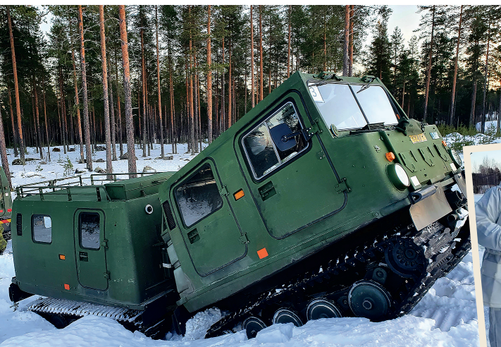
➔ Bandvagnar och snö en perfekt kombination. – A match made in heaven!