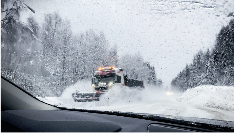
➔ Den vanligaste olyckstypen bland bilister är mötesolyckor.