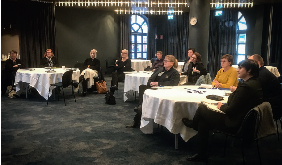
➔ Deltagarna kom från flera olika frivilliga försvarsorganisationer.

RIKSHEMVÄRNSCHEFEN STEFAN SANDBORGS BUDSKAP UNDER WEBBINARIET DEN 5 OKTOBER 2020