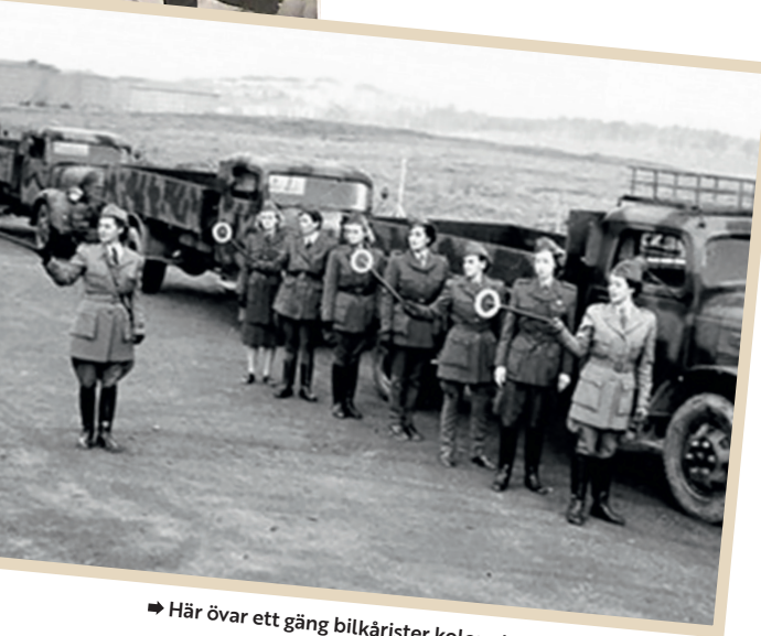
→ Här övar ett gäng bilkåristers kolonntecken 1949.

lottor." Det resulterade i två sommarkurser samma år.