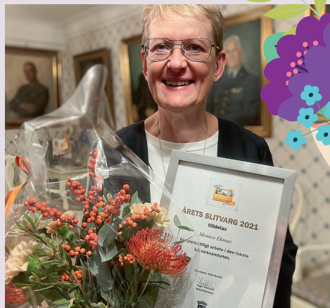
► – Jag tycker fortfarande att det är lika roligt och Bilkåren är en viktig organisation.