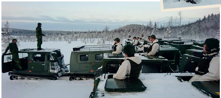
➔ Genomgång inför övning kan ske på olika sätt.

ALLVARET OCH BESLUTSAMHETEN finns där parallellt med den goda stämningen på kursen. Samtliga är här för att de vill göra en insats och bidra om och när det verkligen gäller. Alla har inte möjligheten att ha den gröna verksamheten som sin vardag och dagliga arbetsplats, då kan Bilkåren och Hemvärnet göra det möjligt att göra något som man