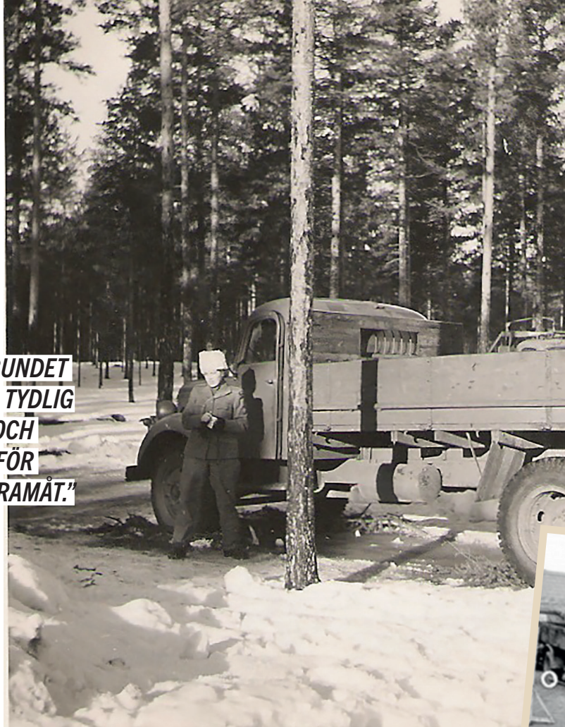
➔ En bilkårist poserar vid sitt fordon under sin vinterutbildning.

"RIKSFÖRBUNDET ... HADE EN TYDLIG RIKTNING OCH AMBITION FÖR ARBETET FRAMÅT."