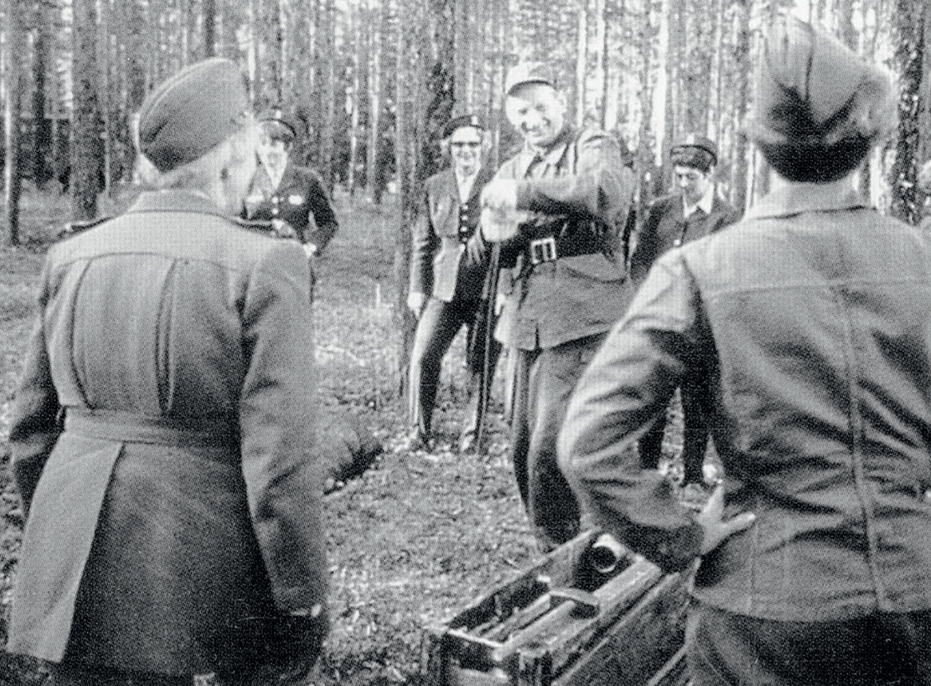
➔ Genomgång av tältförläggning.

ligt gott”. Regementschefen och de manliga instruktörerna hade tyckt ”att kvinnor i hög grad var lämpade såsom bilförare och mekaniker” . Samtidigt kom man fram till att kvinnor borde bli ersättningsförare inom livsmedelsförsörjningen.