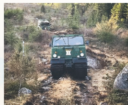
♥ Villingsberg, mars 2020

En härlig bild från terrängkörningen på GK Bandvagn i Villingsberg.