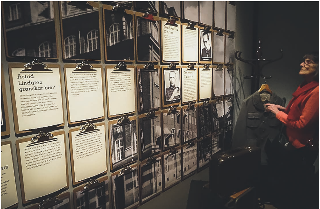
➔ Utställningen kan ses som ett erkännande och en upprättelse för deras insatser.

NÄR UTSTÄLLNINGEN PÅ Armémuseum invigdes närvarade ett par hundra inbjudna gäster, sannolikt gräddan av det Sverige har av underrättelsefolk.