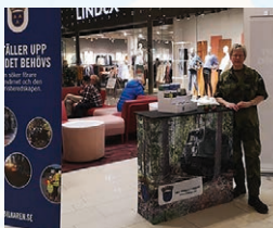
♥ Växjö, mars 2020

Internationella kvinnodagen och Bilkåren är på plats.