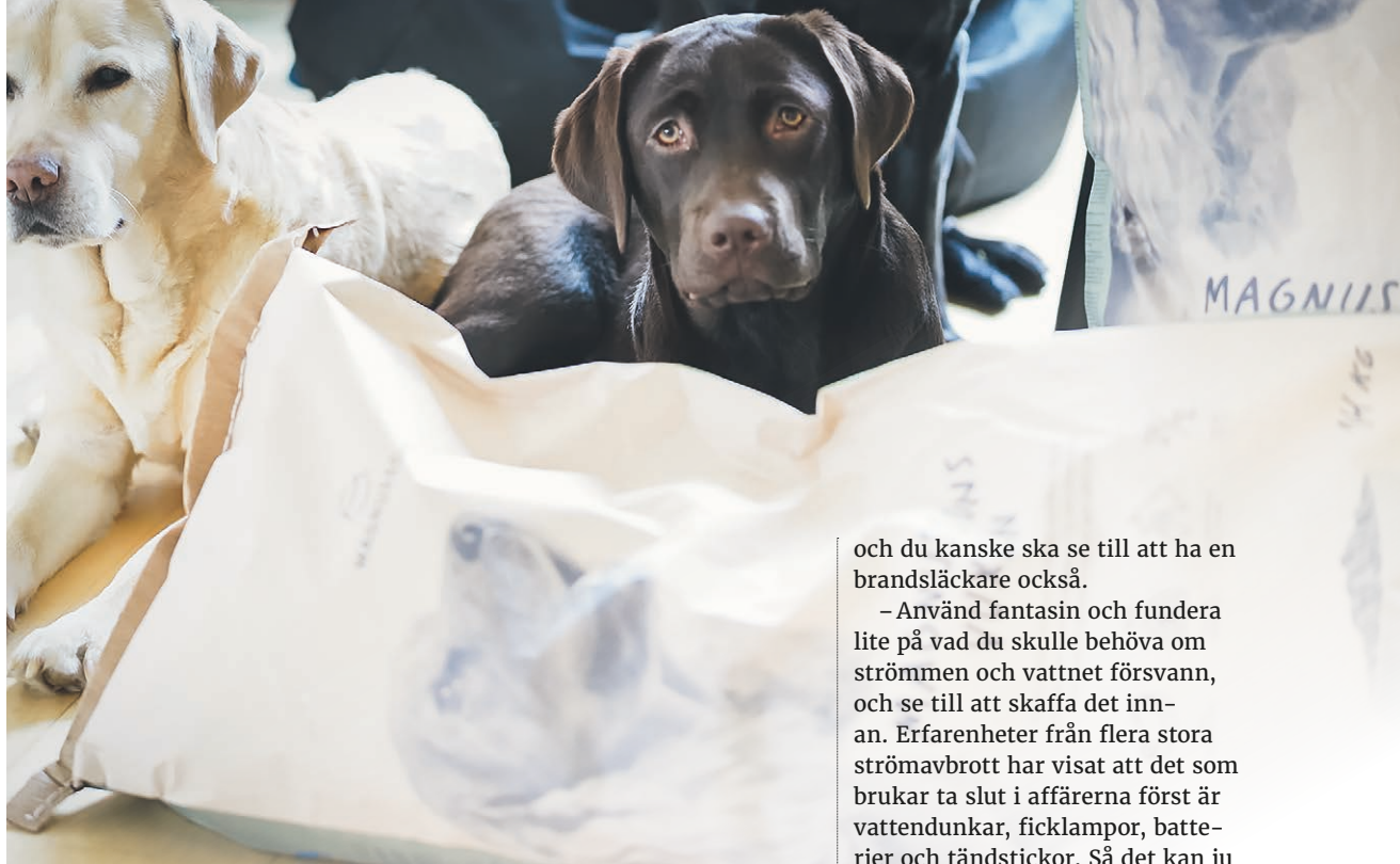
➔ Viktigt att även tänka på våra djur.

bara bli gammalt hemma hos oss. När det gäller mat ser vi helt enkelt till att alltid ha hemma extra mycket av sådant som är lättlagat och ger bra näring och som vi ändå brukar äta. Vi har ett extra lager av det, och då och då gör jag