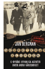
➔ Sekreterarklubben av Jan Bergman.

Hon lyfte även fram de många hundra kvinnor som arbetade för Försvarsstabens kryptoavdelning (FRA:s föregångare) där de gjorde en imponerande insats genom att dechiffrera kryptomeddelanden.