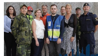
Tillsammans övar vi för ett starkare samhälle

Rapporten fokuserar på hur offentliga aktörer och frivilliga försvarsorganisationer tillsammans kan möta behov av bland annat rekrytering, utbildning och övning av förstärkningsresurser för civilt försvar. ☺