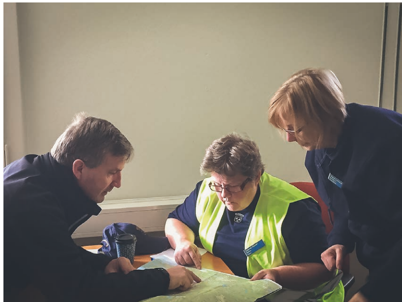
➔ Det finns många olika uppgifter vid höjd beredskap.

– Ni har en utvecklad roll som är en av förutsättningarna för Försvarsmaktens tillväxt. Tillväxten av försvaret kommer också ge nya möjligheter för bilkåristerna att ha olika befattningar. Var och en måste känna ett ansvar att rekrytera, för vi behöver bli ännu fler för att klara uppdraget. ☺