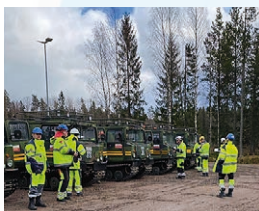
♥ Värmland, mars 2020

I Horssjön genomförs den här veckan två avancerade 2-kurser med Trafikverkets bandvagnsförare. Det är dags att förnya förarbevisen.