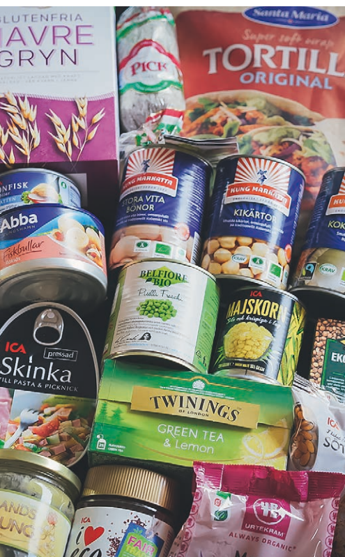
➔ Hållbar mat är ett måste.

och du kanske ska se till att ha en brandsläckare också.