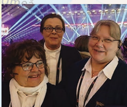
♥ Stockholm, mars 2020

Melodifestivalen på Friends arena. Självklart finns förare från Stockholms Bilkår på plats för att hantera transporterna.