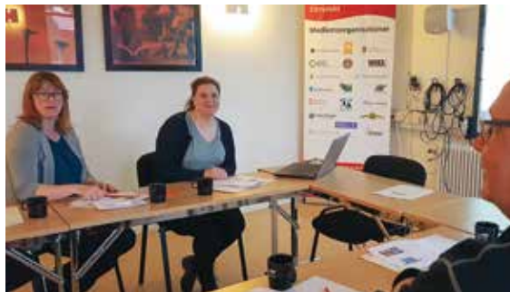
➔ Flitiga deltagare i studiecirkeln.

Studiecirkeln, som är framtagen i samarbete med Studieförbundet, bygger på fem träffar med olika teman: Grunder krisberedskap, Kris, krig och juridik, Mänskliga reaktioner och krisinformation, Det totala försvaret