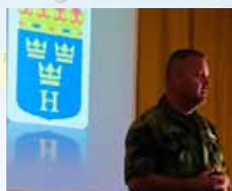
♥ Södertälje, augusti 2019

Idag har vi deltagit på Hemvärnets operation soldatvärde – jämlikhet och värdegrund. Deltagarna kom från nästan alla bataljoner.