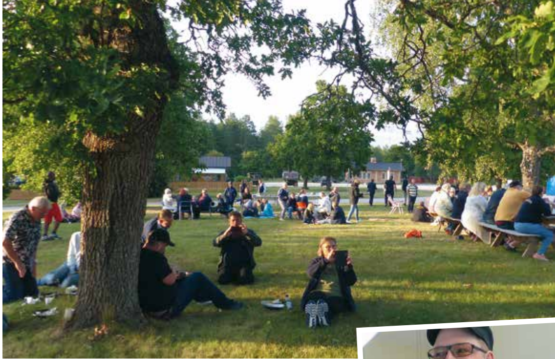
➔ Tillsammans hade alla en härlig kväll med mycket god mat och underhållning.

körsträckan, så de stod som segrare och fick ta emot diplom och priser.