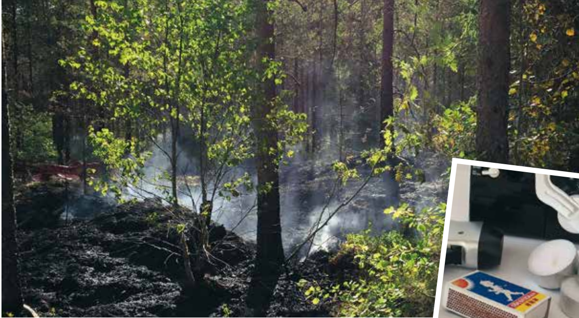
➔ Krisberedskap – en alltmer viktig del att förbereda.