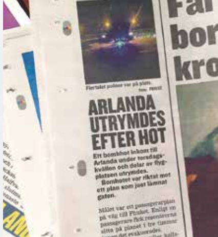
➔ Samhället måste verka för en större förmåga att möta nya hot.

motåtgärder och beredskapshöjning. En gråzonssituation skulle även kunna vara en blandning av olika samhällsstörningar som elavbrott, IT-störningar och omfattande sabotage.