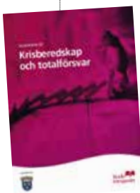
➔ Studiecirkelhäftet finns att beställa på kansliet.

– Vi var inte så många den här gången, men vi hade trevligt med många