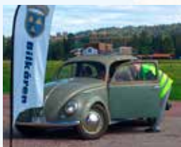
♥ Dalarna, augusti 2019

Classic Lady på Dalarnas Bilkårs station. Tema för året var film och vi har sett allt från Pippi Långstrump till Star Wars.