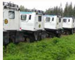
♥ Sverige, augusti 2019

Bilkåren bedriver kurser nästan året runt, både civila och militära. Utan våra duktiga instruktörer och alla deltagares engagemang hade det aldrig varit möjligt.