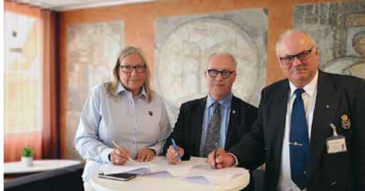
➔ MTE i Gävleborg, ett viktigt steg i rätt riktning.

TYPFALL 5: Utdragen och eskalerande gråzonssituationer.