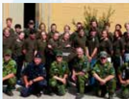
♥ Marma, augusti 2019

Årets Defensecamp avslutat. Idag åkte fyrtio nöjda deltagare hem från Marma. Din tur nästa år?