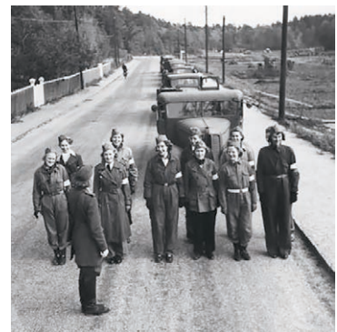
◆ Kvinnor har varit inblandade i militär verksamhet, främst via frivilligorganisationer som Lottakåren, Blå Stjärnan och Bilkåren, sedan början av 1900-talet. Det var först 1989 som kvinnor fick formellt tillträde till alla grenar inom FM.

Ett citat från Astrid Lindgren, som ramade in NOAK-konferensen, får sammanfatta vikten av detta ”Ibland måste man göra saker man inte vågar, annars är man ingen människa utan bara en liten lort”. ☘