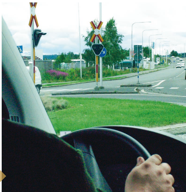
➔ Den nya förarutbildningen lägger större fokus på trafiksäkerhet.