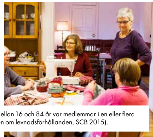
80 procent av den svenska befolkningen mellan 16 och 84 år var medlemmar i en eller flera föreningar 2012–2013 (Ur Undersökningen om levnadsförhållanden, SCB 2015).