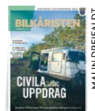
MALIN DREIFALDT, RIKSBILKÅRCHEF

SVERIGES BILKÅRERS RIKSFÖRBUND Kollektivtrafikens hus Centralplan 3 111 20 Stockholm