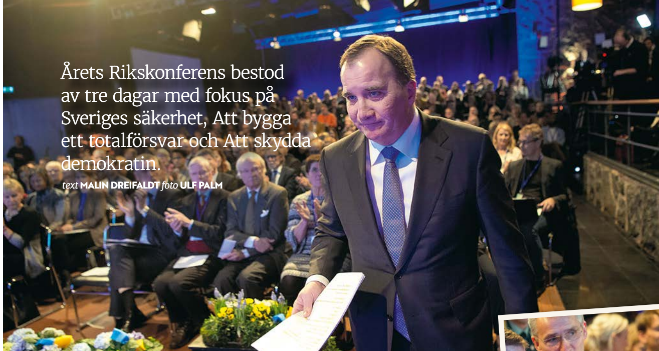
→ Statsministern Stefan Löfven och Kung Carl XVI Gustaf deltog under årets Rikskonferens.