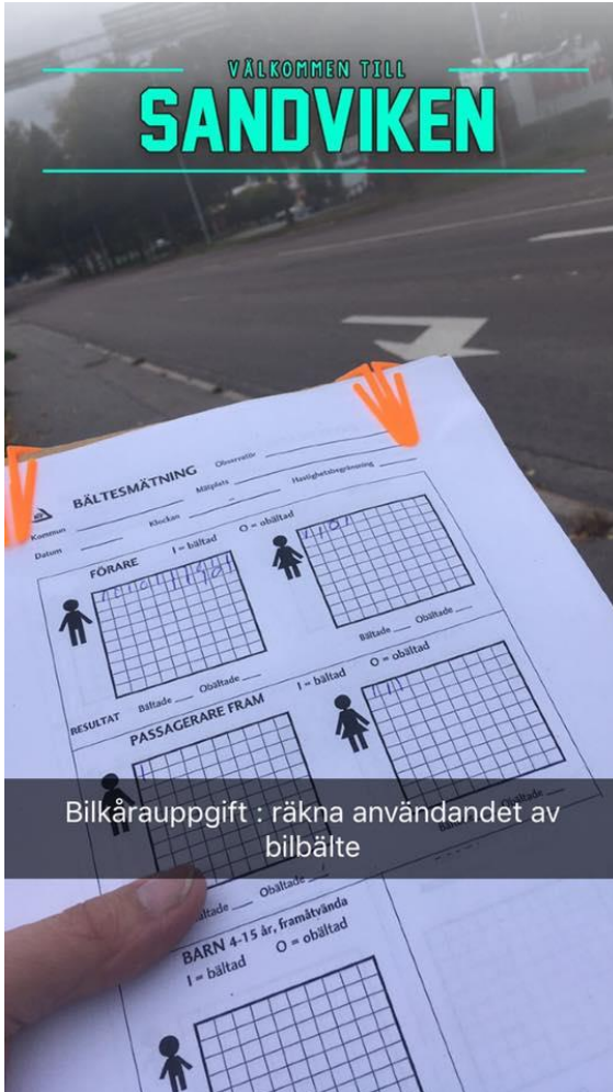
Bilkårauppgift : räkna användandet av bilbälte

Idag så tog Rickard 3 timmar av sin fritid och gjorde nått roligt i äkta bilkårsanda, nämligen att åka till Sandviken och räkna bilbältesanvändningen. Och sedan blev det välförtjänt fikapaus: