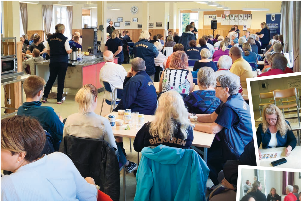
➔ Invigning av Bilkårens första sommarträff.