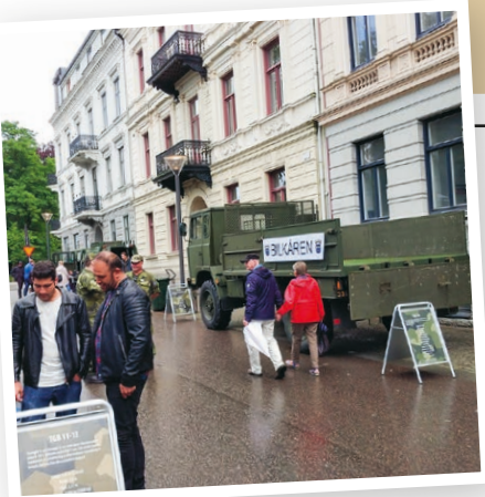
→ Terrängbil 30 i Helsingborg under HX-festivalen.