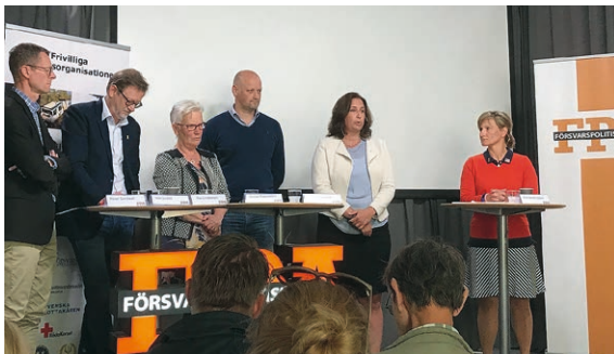
➔ Debatt om frivilligheten inom totalförsvaret.

FPA BÖRJAR PÅ söndagen och avslutas på torsdagen. Under dagar-